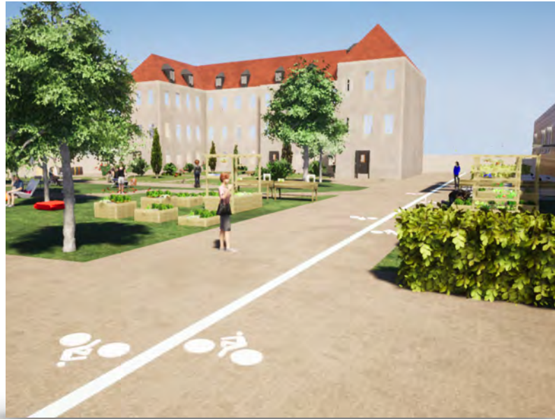
Site Victor Dumay