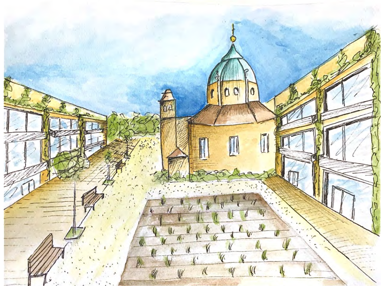
Site Victor Dumay